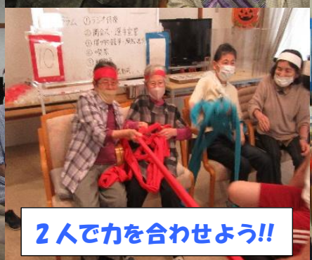
2人で力を合わせよう!!